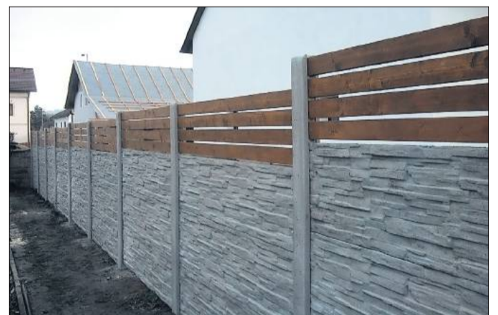
Besonderer Charme auch in Verbindung mit Holz