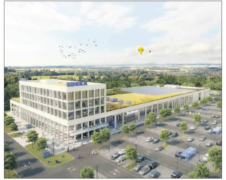
Die Außenansicht des geplanten Neubaus des E-Centers Offenburg Foto: Architekturbüro Müller+Huber/Link3D

jahr 2022 mit dem Abriss des Gebäudes aus den 1970er Jahren beginnen. Die Eröffnung des neuen Marktes ist für das Jahr 2024 geplant. In der Bauphase des neuen E-Centers wird Edeka Südwest den Betrieb auf dem Gelände des ehemaligen Baumarkts in der Schutterwälder Straße fortsetzen, wo auch die rund 100 Mitarbeitenden weiterbeschäftigt werden. Mehr dazu gibt es unter stadtanzeiger-ortenau.de/65734 .